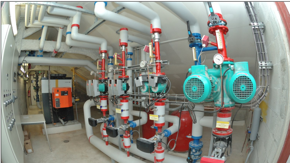
Chaufferie collective gaz