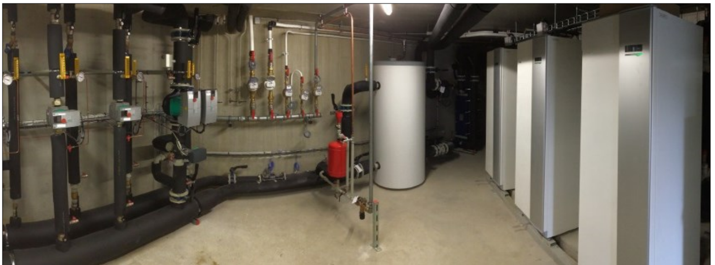
Production de chaleur et de rafraichissement assurée par 3 pompes à chaleur

Maitre d'ouvrage : JFC IMMOBILIER à LONS LE SAUNIER (39)