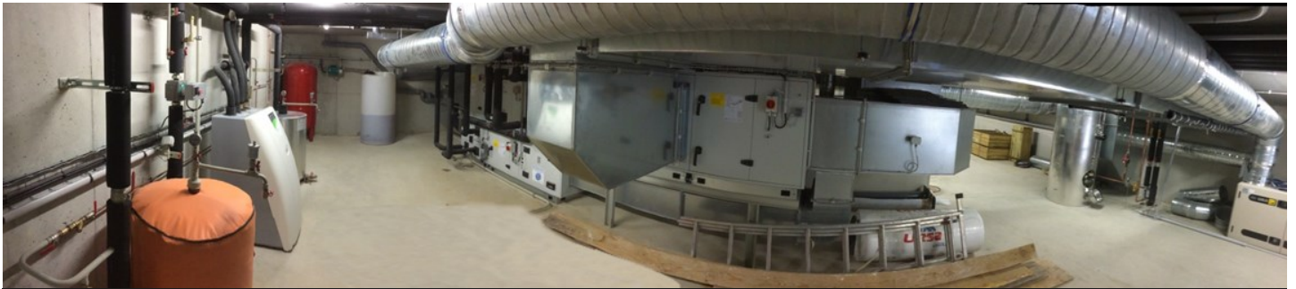
Traitement d'air spécifique de la piscine